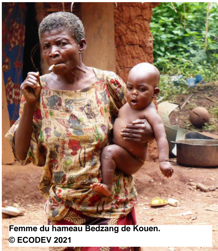
Femme du hameau Bedzang de Kouen.