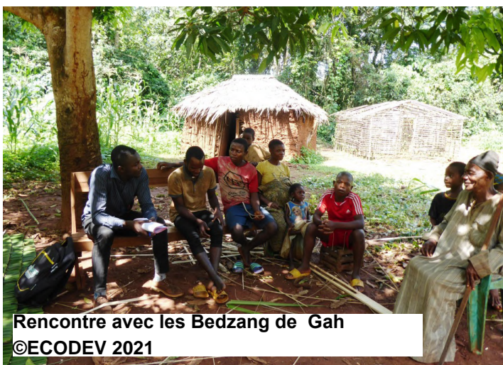
Rencontre avec les Bedzang de Gah

La réalisation d'une sensibilisation de masse et de proximité répétée permettra de mieux éveiller l'attention et suscité l'intérêt chez les Bedzang ; car elle constitue la première piste de solution à explorer dans un contexte où aucune information relative à leurs droits et leur protection en particulier n'est mise à leur disposition. Cependant, cette sensibilisation serait plus bénéfique en s'inscrivant dans un processus de valorisation de leurs droits ciblant à la fois leurs droits à la terre et aux espaces de prise de décision. L'association Écosystèmes et Développement (ECODEV) met déjà en œuvre dans la localité le projet Sécurisation des Droits Fonciers et Forestiers de quatre hameaux Bedzang (SFFB 2) 9 sur les sept que compte l'arrondissement de Ngambé-Tikar 10 rendu à sa deuxième phase, en partenariat avec Global Greengrants Fund (GGF). En effet, Ngambé-Tikar est sujet à des pertes de couvert forestier accrues causées notamment par diverses pressions anthropiques caractérisées par l'augmentation chaque année des superficies des exploitations agricoles ; exploitations forestières