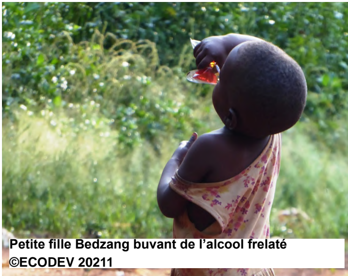
Petite fille Bedzang buvant de l'alcool frelaté

La cause Bedzang est une cause d'importance humanitaire, au regard des menaces qui pèsent sur ces derniers. Il urge donc d'y apporter des correctifs afin de faire en sorte que les Bedzang retrouvent leur dignité de peuple autochtone dans sa composition la plus absolue. Pour y arriver, deux axes d'actions peuvent être envisagés. Il s'agit notamment de la sensibilisation couplée à un processus de valorisation de leurs droits sur les espaces occupés, et de réfléchir sur une meilleure représentation des Bedzang au niveau local mais aussi national. Il en va ainsi d'un intérêt à double variables, sur le plan de la pratique et celui du changement des politiques publiques.